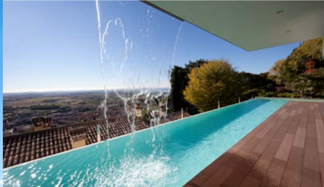
BAIXA ABSORÇÃO DE ÁGUA