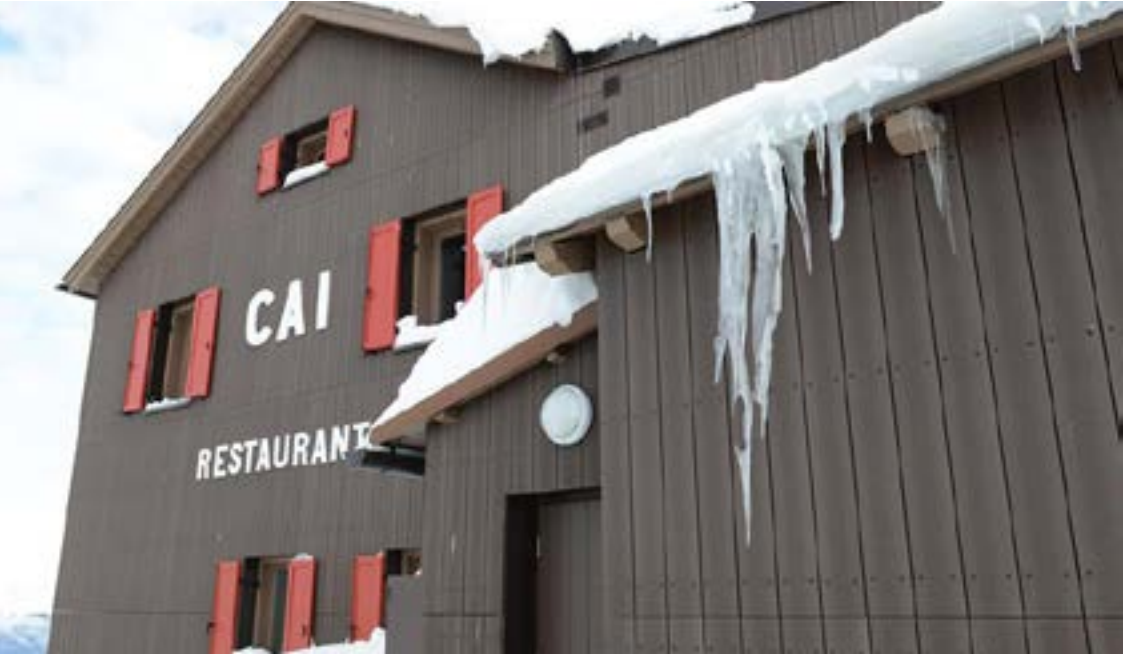
RESISTÊNCIA ÀS INTEMPÉRIAS